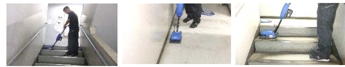
【スクエア9】を使用しての清掃の様子

弊社では、こういった使用する【道具】に対しても見直し導入コストは掛かりますが、仕上がりやお客様の為になると判断した資機材には、積極的に導入を図っていきたいと思います。