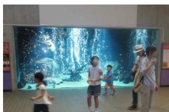
入口正面の大水槽

<場所> 東京都足立区保木間2-17-1 TEL 03-3884-5577 <休園日> 毎週月曜日・年末年始 (祝日の場合は翌日) <開園時間> 9:30~17:00 (2月~10月) 9:30~16:30 (11月~1月) <入園料(1日券) / (年間パスポート)> 大人 300円 / 1200円 小中学生 150円 / 600円 幼児 無料