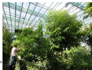
チョウの舞う大温室

また毎月違った行事を企画し、十月は金魚すくいなど生きものごふれあえるイベントが目白押しです。このような、いつ何回行ってもお客様を飽きさせない生物園の取り組みの甲斐もあり、今年度四月からの入園者数が八月に十万人を突破しました。これは開園史上最速記録です。地域の多くの方々に支持されている足立区生物園に、ぜひ一度足をお運びください。