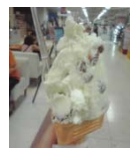
←ジェラートもお勧めです