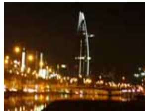
ロマンチックな夜景