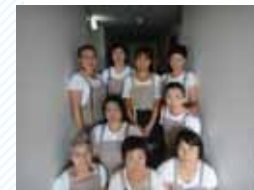
当日お話を伺ったスタッフの皆さん

スタッフの皆さんの明るく、きびきびとした仕事ぶりをみていると、お客様に清潔で快適な空間を提供したいという熱意を感じました。