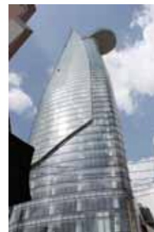
上部の円形の場所がヘリポート