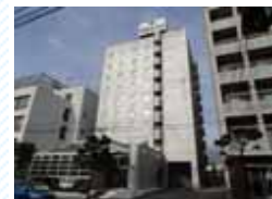
甲府駅北口徒歩5分