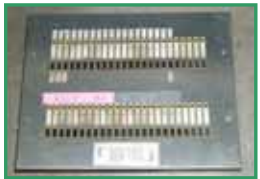
旧リモコンスイッチパネル

プロダクトコントロール(PC)、シーケンサ 特定メーカーの商品名)の方が一般的です。簡単に言うと、このPCに、照明器具をグループ化したプログラムを書き込み、一番使い易い場所(部屋の出入り口付近など)に液晶のタッチパネル式表示器を設置し、表示された画面の必要箇所を選択して、照明の点灯 消灯を行います。また、グループ分けは、いつでも簡単に変更できます。