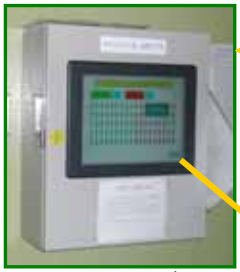
メインコントロールボックス