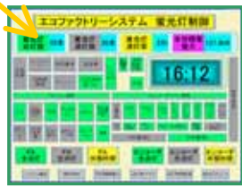
タッチパネル式表示器