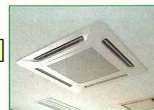
事務所などでよく見られる、天井に取り付けてあるエアコン室内機です。このカバーを外し、ファンなどを分解します。