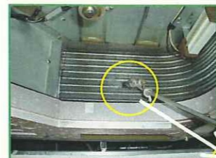
コイルを、高圧洗浄機で洗浄します。