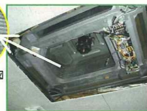
エアコンの中はこの様になっています。内部の側面部分がコイルです。