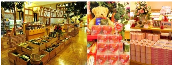
ハイジの村限定のオリジナル商品もたくさんあります

2月1日〜2月28日まで、レストランボルケーノにて当日前10時の気温が低いほどメニューが割引になるイベントを実施しています。0度未満で10%、マイナス5度未満で30%、マイナス5度以下では50%オフになります。対象メニュー等はHPでご確認ください。